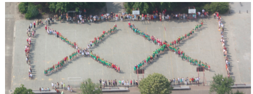
Kusjes vanuit Knalkamp

Roger Federer heeft voor de zesde keer Wimbledon gewonnen. Voor de 27-jarige Zwitser is het zijn 15e grandslamzege: één meer dan Pete Sampras, een record. Het werd een partij op het scherp van de snee, die liefst 4 uur en 16 minuten duurde. Federer wordt nu ook weer de nummer één van de wereld.