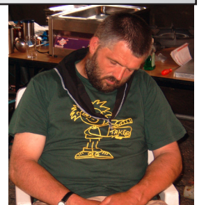
De Fik kon overal in slaap vallen.

Aqui é o Knalkamp là é sol Aqui é o Knalkamp là é sol E meillor kee iema viagem pra Roma E meillor kee iema viagem pra Roma Aqui é o chao e Aqui é o chao e Là é o tètò Là é o tètò Um campo para sonhar Um campo para sonhar