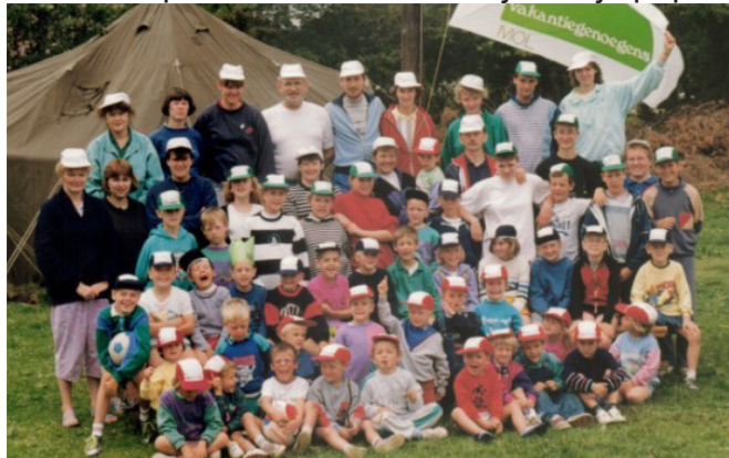
Dit was ooit heel het kamp! UPDATE: Verbeterde lijst!