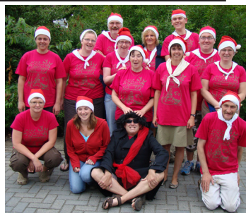
Nu dat het jaar bijna voorbij is danken we graag de keukenploeg voor het lekkere eten dit jaar!!